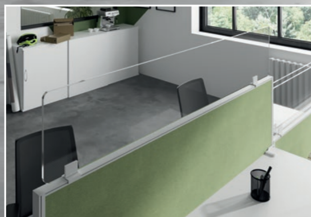
SICHTSCHUTZ MIT GLASAUFSATZ HINTER-TISCHAUFSATZ STOFF: LUCIA Y096: APPLE

Der 30 cm hohe Glasaufsatz sorgt für erweiterte Sicherheit im Social Protecting und fügt sich mit den abgerundeten Ecken harmonisch in das Gesamtbild ein. Erhältlich ist der Aufsatz in Klarglas Acryl 5mm oder in Klarglas ESG 5 mm in verschiedenen Längen (800 - 2000 mm)