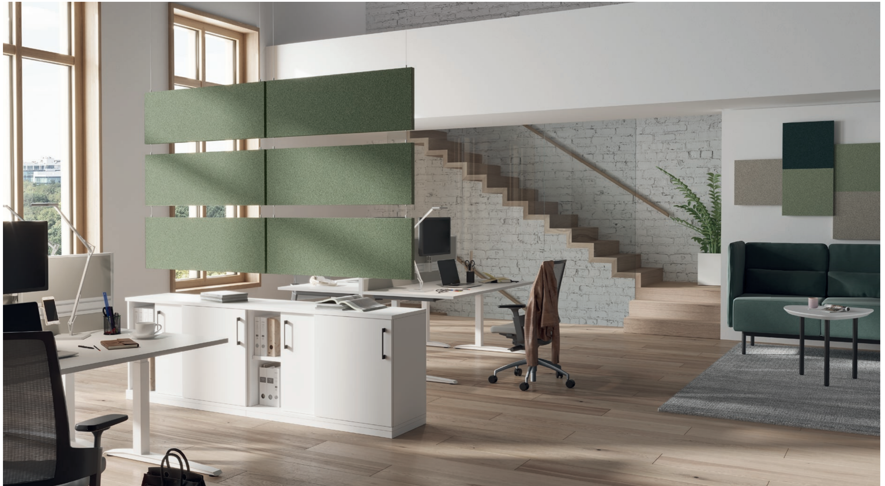
BAFFEL (OBEN, MITTE, UNTEN) STOFF: BLAZER LITE LTH60 SHELTER

Die Baffel sind in den Formaten und Anordnungen individuell einsetzbar. Als optische Raumteilung oder als Akustik Elemente in Reihe unter der Decke hängend geben sie Arbeitsbereichen Struktur und sorgen gleichzeitig für eine gute Raumakustik.