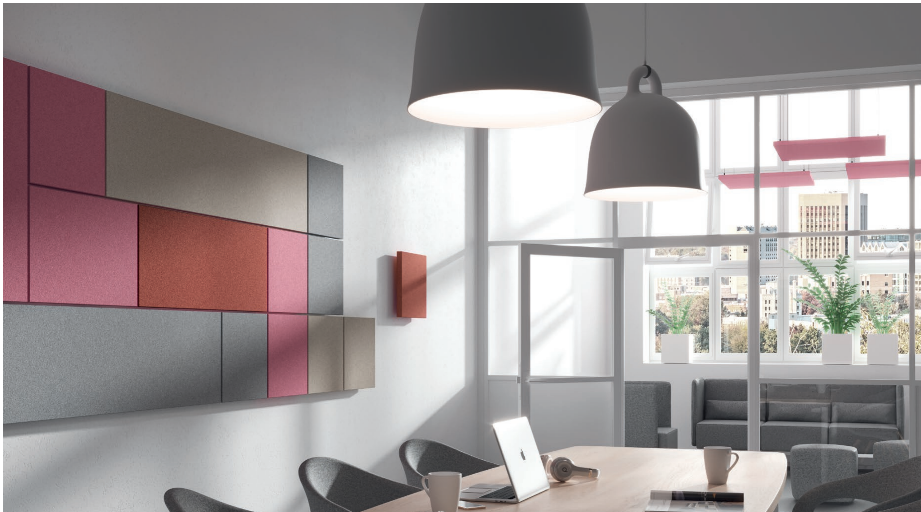
Mit den eckigen Absorberelementen lassen sich wahre Kunstwerke schaffen. Klare Linien, klare Formen, interessante Farbvariationen und Anordnungen.